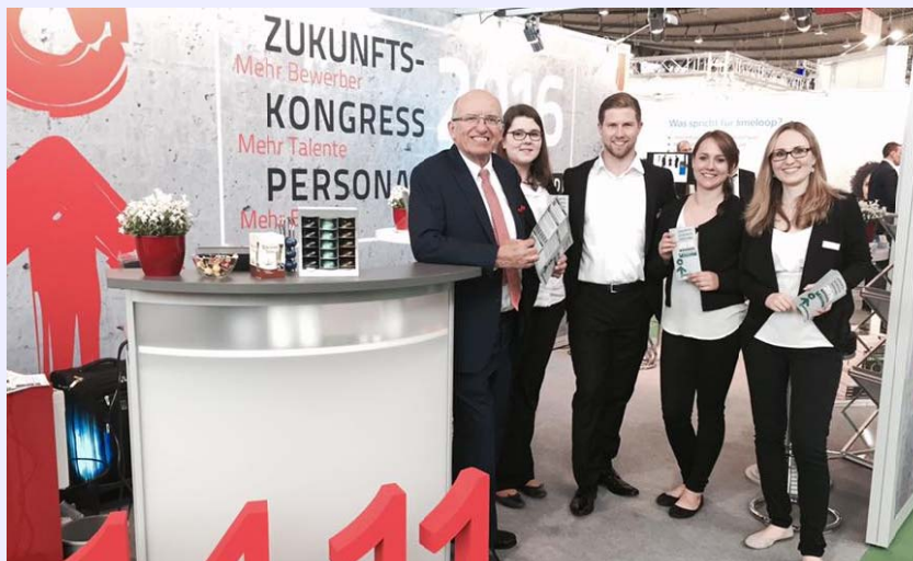
Das ABC-Personal-Team auf der PERSONAL2016 Süd in Stuttgart

PS: Wir vom ABC-Personal-Team haben auf der PERSONAL2017 Süd wie im vergangenen Jahr wieder einen Ausstellungsstand! Kommen Sie doch auf eine Tasse Kaffee an unserem Stand vorbei! ☺