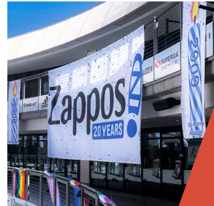
Zappos, Las Vegas