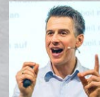
Jörg Mosler Mitarbeitergewinnung Die perfekte Strategie