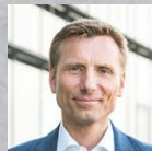
René Penselin Unternehmen lernen online Der Weiterbildungsmarkt im Umbruch!