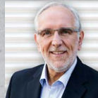
Friedbert Gay Hire for attitudes! Wie Sie Menschen mit der richtigen Einstellung gewinnen