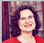
Gaby S. Graupner Spring über deinen Schatten Jeden Tag zahlst du einen Preis – du entscheidest welchen!