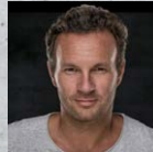
Pascal Feyh Optin-Page Profitaktiken Sofort erfolgreich Interessenten für dein Business gewinnen